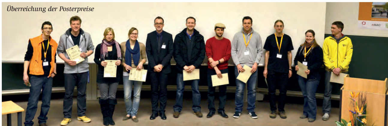
Überreichung der Posterpreise