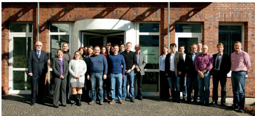
Teilnehmer des Junganalytikertreffens 2013 in Essen

Wir Junganalytiker waren beeindruckt von der Vielfalt der Aufgaben, die bereits in der Komplexität und der Optimierung der Probenahme beginnt, die je nach zu untersuchenden Parametern, Matrix und Probennahmeort zu einer Herausforderung werden kann. Das Kooperationslabor bietet seinen Partnern und Kunden ca. 600 physikalische, chemische und biologische Untersuchungskenngrößen, Tendenz steigend. Die Zahl der untersuchten Proben beläuft sich hierbei jährlich auf ca. 10.000 mit insgesamt etwa 200.000 Einzelbestimmungen. Mitunter werden Pflanzenschutzmittel und Biozide, phosphororganische und bromierte Flammenschutzmittel, synthetische Komplexbildner, polyzyklische Aromaten, Weichmacher (Phthalate), perfluorierte Verbindungen, polychlorierte Biphenyle, Arzneimittelwirkstoffe und Röntgenkontrastmittel in wässrigen Systemen analysiert.