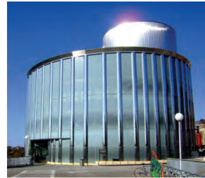
Tagungsort des Aerosol Mass Spectrometer Users Group 13th Annual Meeting: Gebäude „Science Teaching & Student Service“ direkt am Ufer des Mississippi auf dem Campus der University of Minnesota in Minneapolis.

Am zweiten Tag standen Software-Probleme und –Weiterentwicklungen im Vordergrund. Der Tag startete mit der Session PMF was für Positive Matrix Factorization steht. Dies ist ein Tool zur Analyse der Messdaten. Zu-