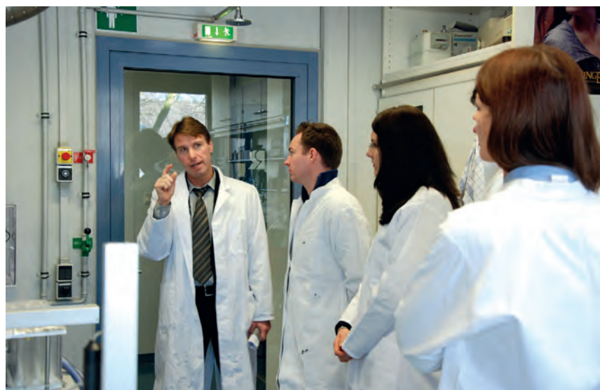
Junganalytiker bei der Führung durch das Kooperationslabor von Ruhrverband, Emschergenossenschaft und Lippeverband

wurde zunächst jeweils ein kurzer historischer Abriss gegeben und die organisatorischen Strukturen der Verbände und des gemeinsamen Kooperationslabors dargestellt. Das chemische und biologische Kooperationslabor wurde gegründet, um das naturwissenschaftliche Know-how und die Kompetenzen aller Wasserwirtschaftsverbände zu bündeln und somit die Effizienz und Flexibilität zu steigern. In den beiden Vorträgen wurde kurz auf die Unterschiede in der Wasserwirtschaft der Flussysteme Ruhr und Emscher/Lippe in Bezug auf die Trinkwassergewinnung, die Kläranlagenüberwachung, den Wassersport, die Energiegewinnung und die Nutzung als Kühlwasser eingegangen. Es wurden Beispiele der Analyse von wasseranalytisch relevanten Verbindungen wie z. B. EDTA als synthetischem Komplexbildner und deren Konzentrationsänderungen in Gewässern über Jahrzehnte aufgezeigt. Durch diese Langzeitkontrollen werden Grenzwertüberschreitungen umweltrelevanter Verbindungen in Gewässerproben aufgedeckt. In der daraus resultierenden Frage nach dem Eintragsort wird der Analytiker zum Detektiv: Die Analytik leistet einen wesentlichen Beitrag bei der zielgerichteten Suche nach dem Verursacher. In Zusammenarbeit mit Behörden kann das Labor somit zur Verbesserung der Qualität von Gewässern einen großen Beitrag leisten.