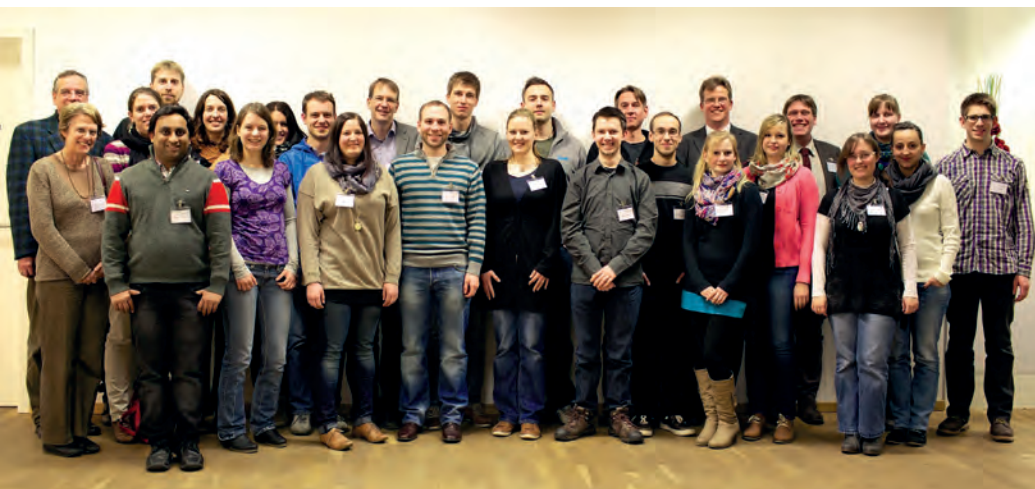
Teilnehmer des 7. Interdisziplinären Doktorandenseminars in Berlin

dem gezeigt, wie durch elektrochemische Methoden Auswirkungen verschiedener Einflüsse auf die Vitalität von Zellkulturen detektiert werden können. Im Bereich der Optimierung pharmazeutischer Problemstellung wurden Wirkstoff-Cokristalle und In-Line Verfahren zur Untersuchung der Tröpfchengröße von PIT-Emulsionen vorgestellt. Auch die Poster spiegelten ein breites Spektrum wider: Von Nanotubes als Erkennungselemente zur Detektion von Nanopartikeln bis hin zu miniaturisierter Online-detektion von isoelektrischen Punkten durch Freiflusselektrophorese.