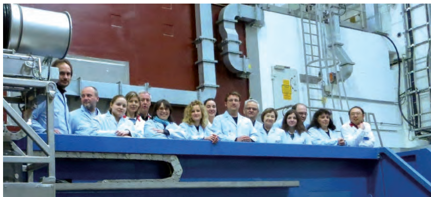
Teilnehmer über dem Reaktorbecken des FRM II