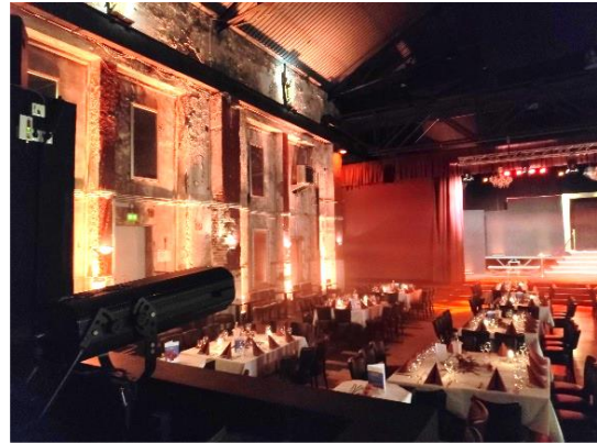
Abbildung 4: Historische Zeche Ewald, heute ein Veranstaltungsort mit rustikalem Charme